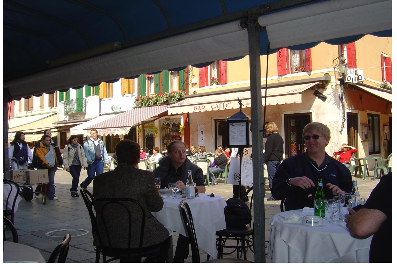
6) ... und Exkursionen machen auch auf einer winzigen Insel schnell mal Appetit !