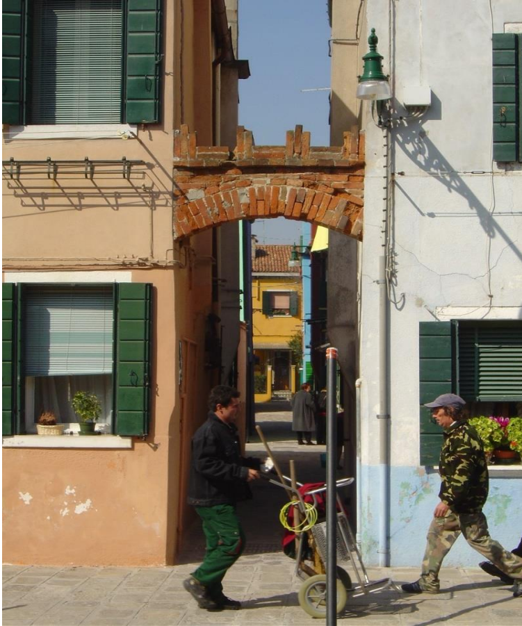
5) Sogar gearbeitet wird - manchmal ...