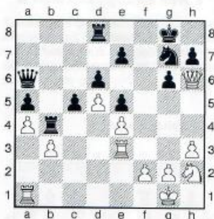
14. Weiß am Zug