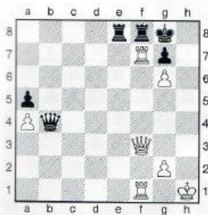
10. Weiß am Zug