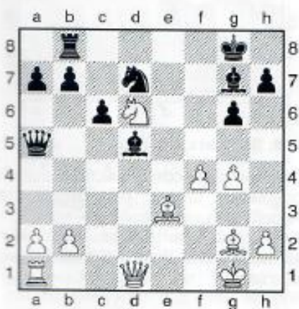
12. Weiß am Zug