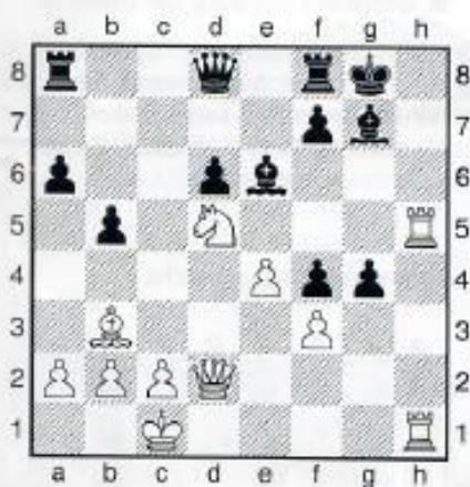
11. Weiß am Zug