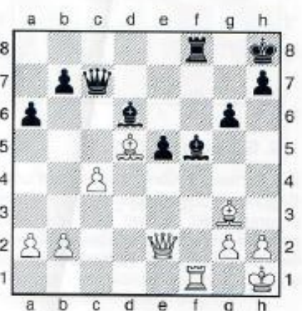
18. Weiß am Zug