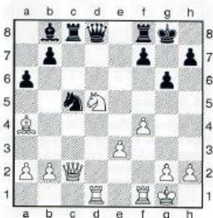
15. Weiß am Zug