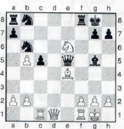
17. Weiß am Zug