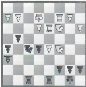
Cruz – Studer Peru – Schweiz (Herren)

Wie kann Schwarz einen entscheidenden Angriff gegen den weißen König erzwingen?