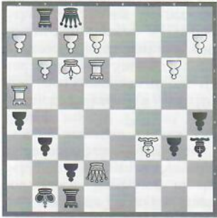
Hillarp Persson – Lauras Schweden – Litauen (Herren)

Wie kann Schwarz die Überlastung der weißen Figuren ausnutzen?