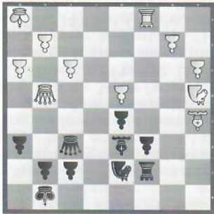
Nachbayewa – Huang Kasachstan – China (Damen)

Warum war der letzte weiße Zug 36. Ld2xa5 ein grober Fehler?