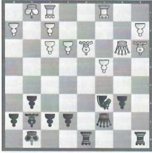
Amura – Abdumalik Argentinien – Kasachstan (Damen)

Warum war der letzte weiße Zug 36. Ld2xa5 ein grober Fehler?