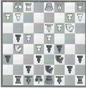
De Seroux – Nadirjanowa Schweiz – Usbekistan (Damen)

Wie kann Schwarz einen entscheidenden Angriff gegen den weißen König erzwingen?